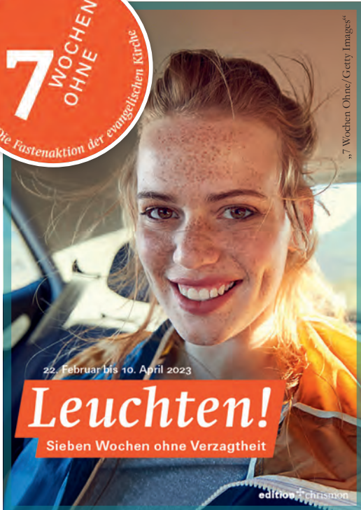
7 Wochen Ohne/Ceety Images

7 WOCHEN OHNE Die Fastenaktion der evangelischen Kirche